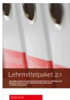
Lehrmittelpaket 2.1 (EFZ, Fachrichtung Bäckerei-Konditorei)